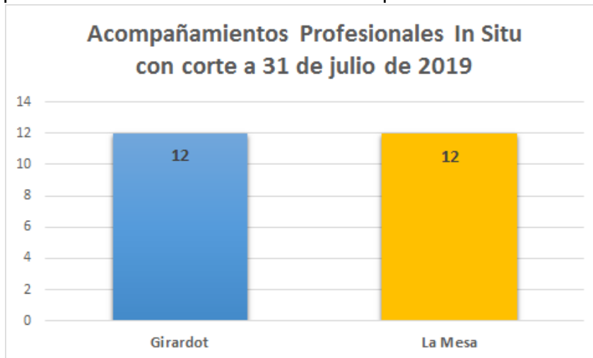
Grafica No. 4: Seguimientos realizados a 31 de Julio de 2019.

hechos económicos realizados dificultando el acceso al sector financiero, al no poder demostrar que tienen capacidad de pago para acceder a créditos financieros que apalanquen el crecimiento de sus negocios. La segunda debilidad corresponde al mal manejo de los inventarios que no les permite la toma de decisiones acertada para la planeación de compra de productos para la venta. Finalmente, los microempresarios de la región desconocen las consecuencias reales que implica una demanda laboral, por el incumplimiento la normatividad laboral colombiana vigente que podrían llevarlos al cierre definitivo de su empresa.