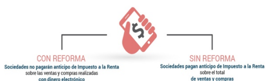
Figura 3.- Rebaja del anticipo del Impuesto a la Renta

Rebaja del anticipo de Impuesto a la Renta a todas las empresas que utilicen efectivo desde mi celular (dinero electrónico).