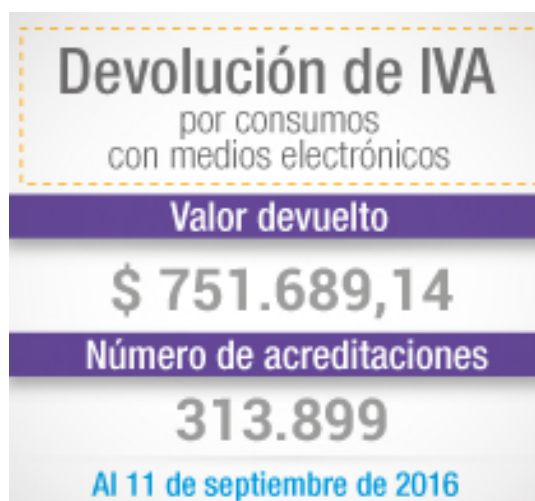
Figura 1.- Devolución del IVA

Los contribuyentes que pertenecen al RISE y pagan a tiempo sus cuotas mensuales o anuales a tiempo con efectivo desde mi celular (dinero electrónico), obtienen una devolución del 5% del valor de la cuota, más el 5% por comprar y vender con efectivo desde mi celular (dinero electrónico).