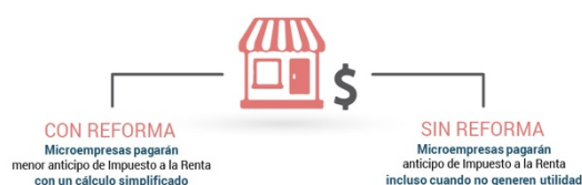
Figura 2.- Reducción del Impuesto a la Renta para microempresas

Reducción del anticipo de Impuesto a la Renta de más de 66.000 microempresas a través de un cálculo más simple