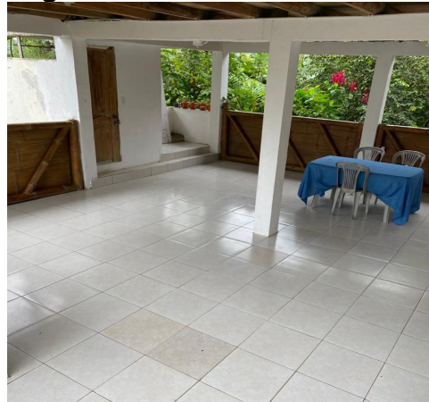
Figura 4: Restaurante comunitario