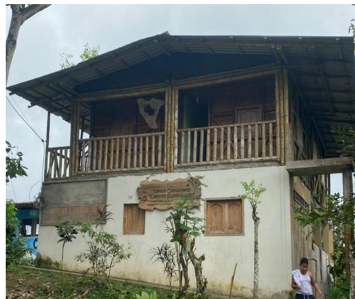
Figura 3: Centro comunitario, alojamiento y restaurante.