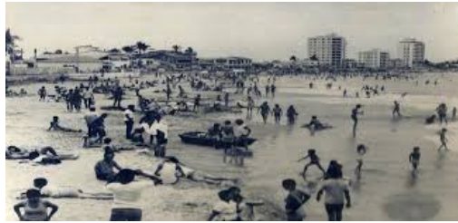
Figura 2 Antigua ciudad Salinas Los autores

En el centro de Salinas se encuentra ubicada la ciudad de Salinas, cabecera cantonal, el cual ha sido denominado como uno de los mejores barrios residenciales de la provincia de Santa Elena, donde las actividades comerciales minoristas y el turismo conservan un papel fundamental en su económica. A pesar de que la exuberante ciudad balneario que se presencia en la actualidad ha sido objeto de renovación, al ser uno de los patrimonios turísticos más concurridos del país; por lo cual el gobierno municipal, la empresa privada y demás interesados intervinieron en el proceso de cambios físicos, estructurales y la conservación de los patrimonios culturales.